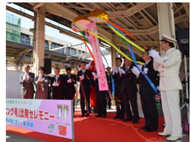
セレモニーの様子