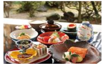
料亭 能登新 昼食