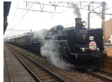
SL C57-180 号機