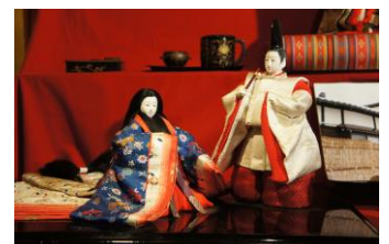
町屋の人形さま巡り