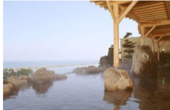
大観荘せなみの湯 露天風呂