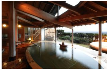
夕映えの宿汐美荘 露天風呂