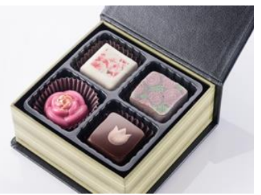
パティスリーグレンズのシェフパティシエによる 花をテーマにしたオリジナルチョコレート 花とセットで2,000円(税込) *1日50個の数量限定