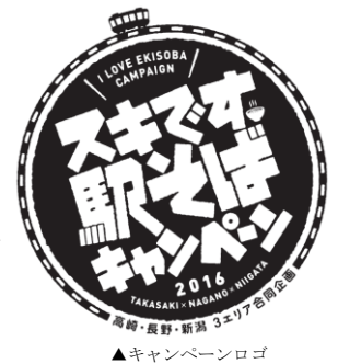
▲キャンペーンロゴ

【参加方法】期間中対象店舗をご利用していただき、「駅そばパンフレット」に付いている応募はがきにスタンプを押印のうえご応募ください。応募はがきに必要事項をご記入のうえ、52円切手を貼って郵送していただくと、スタンプの個数に応じて抽選で下記の景品が当たります。