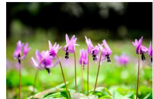
カタクリ(イメージ)