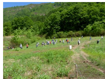
山菜収穫体験(イメージ)