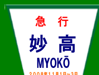
ミニヘッドマークシール (イメージ)

シリーズ全てのミニヘッドマークシールを集めた方全員に、記念乗車証明書が入る特製記念台紙をプレゼントします。 (詳しくは、最終回で発表します。)