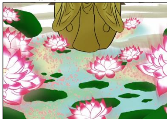
（第一弾：蓮の花のイラスト）