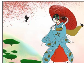
（第一弾：如是姫のイラスト）