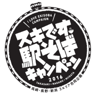
▲キャンペーンロゴ

【参加方法】期間中対象店舗をご利用していただき、「駅そばパンフレット」に付いている応募はがきにスタンプを押印のうえご応募ください。応募はがきに必要事項をご記入のうえ、52円切手を貼って郵送していただくと、スタンプの個数に応じて抽選で下記の景品が当たります。