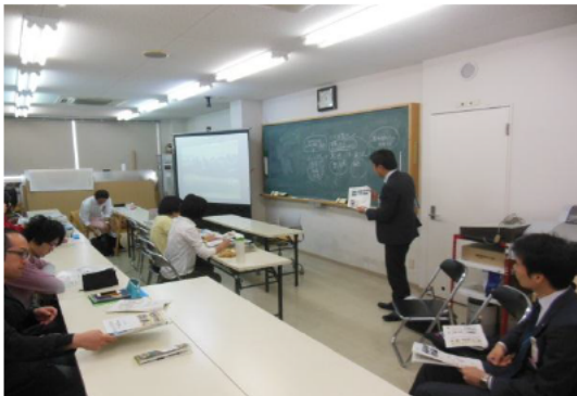
①オリエンテーション