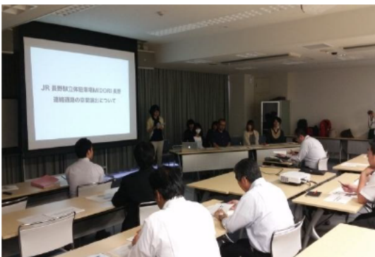
③プレゼンテーション