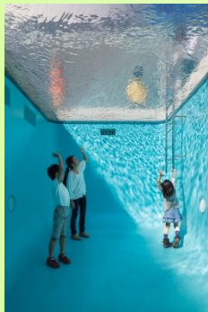
レアンドロ・エルリッヒ 《スイミング・プール》2004 金沢21世紀美術館蔵