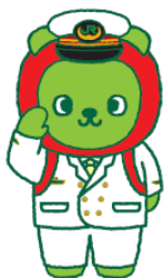
長野県PRキャラクター「アルクマ」 ©長野県アルクマ 14-0020

国鉄色：クリーム色と赤色、あさま色：モスグリーン色とグレー色でデザインされた車両。