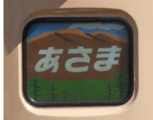
(ヘッドマークイメージ)

黒姫駅の停車時間(往路 10:14~10:35、復路 13:56~14:34)を利用して、ヘッドマークや横サボを「特急あさま」等に変更いたします。