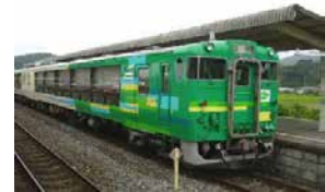
信越自然郷初秋風っこ