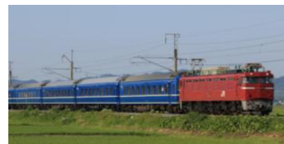
ブルートレイン信州