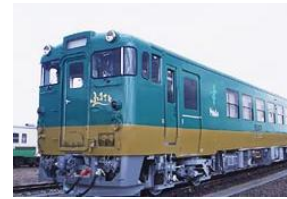
信越自然郷ふるさと