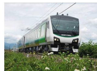
リゾートビューふるさと