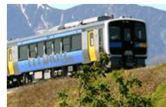
さわやか八ヶ岳高原号