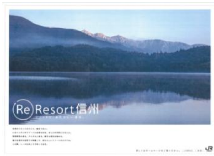
キャンペーンポスター (B0) 大町市/ヤナバスキー場前駅付近から望む青木湖 (J R大糸線 築場駅から約 2km)