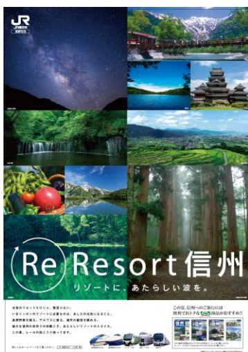
キャンペーンポスター (B1)

J R東日本の首都圏の主な駅や長野支社管内の駅で、夏の観光キャンペーン「 Re Resort 信州 」総合パンフレット、キャンペーンポスターの掲出を実施します。