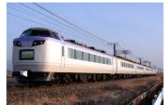
いろいろ山梨ぶどう号