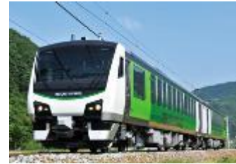
リゾートビュー八ヶ岳