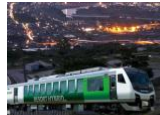
ナイトビュー姨捨