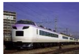
北信濃高原満喫号