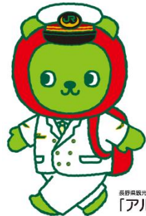
長野県観光PRキャラクター 「アルクマ」