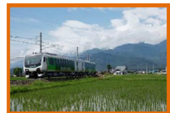
リゾートビューふるさと

※ リゾートビューふるさと 車内にて松本市観光パンフレットやちょっぴり プレゼントをお配りいたします。（松本→穂高間）