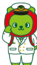
長野県観光PRキャラクター 「アルクマ」