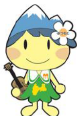
松本市のマスコットキャラクター 「アルプちゃん」

内容 松本市のマスコットキャラクター「アルプちゃん」・長野県観光PRキャラクター「アルクマ」と一緒に記念写真を撮ろう！ ※カメラは各自お持ちください。