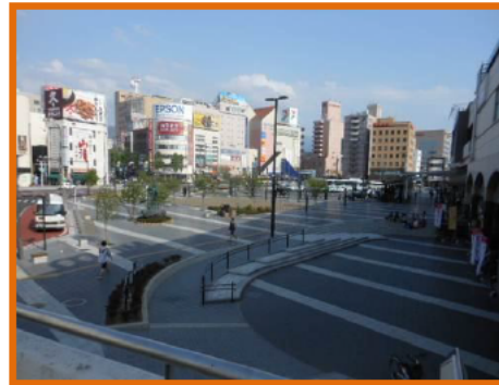
松本駅お城口広場