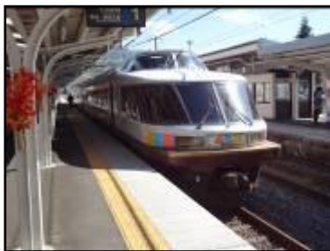
白馬花三昧NODOKA(イメージ)

カーペット車両「NO. DO. KA」を使用したイベント列車。足を伸ばして寛げる車内。大きな窓からは北アルプスの山々が一望できます。4人一組のテーブル席なので、グループやご家族でご利用の際は話が盛り上がること請け合いです。また、車両の両端は展望スペースとなっており、運転土気分も味わえます!