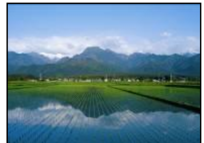
大糸線の車窓からみた北アルプス(イメージ)

※快速「白馬花三昧NODOKA」は全車指定席です。ご乗車の際には乗車券等のほかに指定席券をお求めください。掲載の情報は2012年8月10日現在の情報です。詳細な列車の時刻につきましては駅の時刻表等でお確かめください。天候により、北アルプスの展望はお楽しみいただけない場合があります。予めご了承ください。写真は全てイメージです。