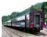
旧型客車(イメージ)

10月の毎週土曜日に、ノスタルジックな雰囲気 の列車旅をお楽しみいただける「旧型客車」を運 転します。