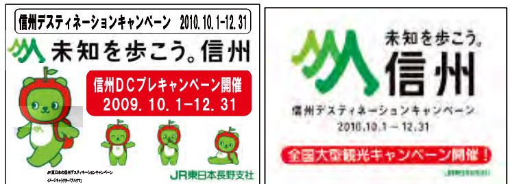
車内吊りポスター(イメージ)