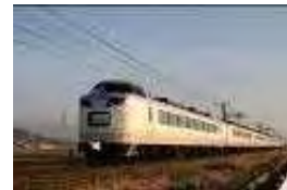
いろどり (イメージ)