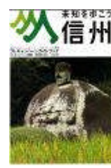
ポスター(イメージ) ガイドブック(イメージ)