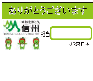
みどりの窓口 氏名札入れ台座(イメージ)