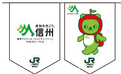
フラッグ(イメージ)