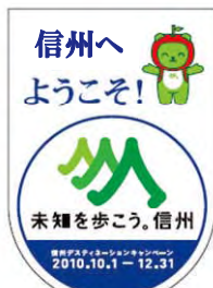
エンブレム(イメージ)