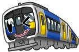
イメージキャラクター 「こうみくん」

イメージカラーは、ハイブリッド車両(キハE200形「こうみ」)の黄と青、そして、自然の緑。 2つのキャラクターが小海線を盛り上げます☆☆