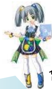
イメージキャラクター 「ぶりっとちゃん」

イメージカラーは、ハイブリッド車両(キハE200形「こうみ」)の黄と青、そして、自然の緑。 2つのキャラクターが小海線を盛り上げます☆☆