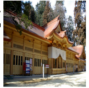
穂高神社 (イメージ)