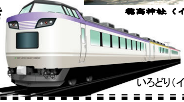
いろいろり(イメージ)