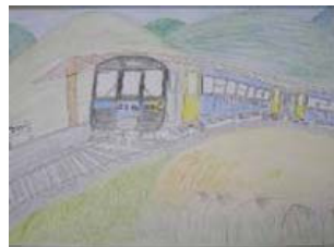
「高原を走る小海線」長野県 宮澤和輝さん