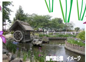
龍門洲公園 イメージ