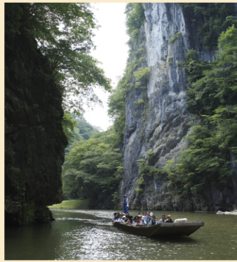
狛鼻溪舟下り (イメージ)