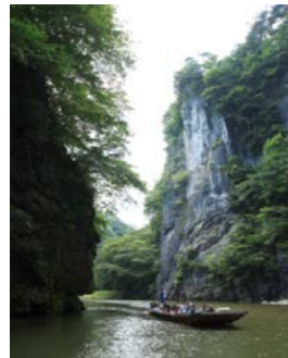
狛鼻溪舟下り(イメージ)

お申し込み・お問い合わせは、お近くの駅にある旅行のお店 びゅうプラザ(一ノ関駅・北上駅・盛岡駅・八戸駅・七戸十和田駅・青森駅)、駅旅行センター(宮古駅・釜石駅※)または、「びゅう予約センター」(0570-04-8950)へ。 ※釜石駅旅行センターは3/31をもって営業終了となります。