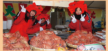
宮古毛ガニ祭り（写真はイメージ）