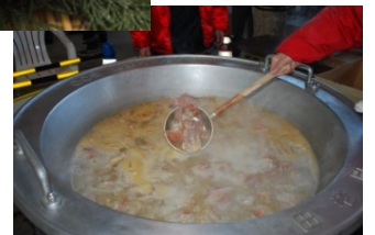
毛ガニ汁のお振舞