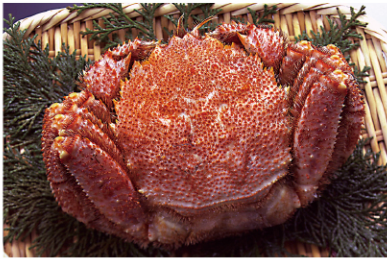
毛ガニ (写真はイメージ)