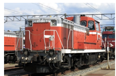
●DE10(盛岡車両センター所属)