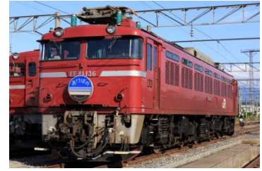
●EF81(秋田車両センター所属)