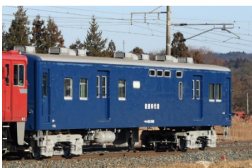
●スユニ50(盛岡車両センター所属)