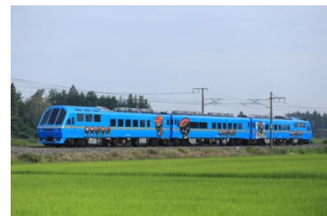
●キハ58系「Kenji」(盛岡車両センター所属)

©2016 Pokémon. ©1995-2016 Nintendo/Creatures Inc./GAME FREAK inc. ポケモン・Pokémon は任天堂・クリーチャーズ・ゲームフリークの登録商標です。