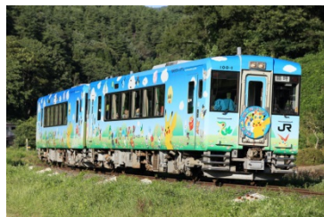
●キハ100系「POKÉMON with YOU トレイン」(一ノ関運輸区所属)