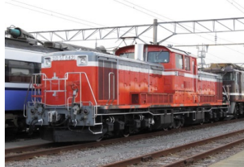
●DD51-842(高崎車両センター高崎支所所属)