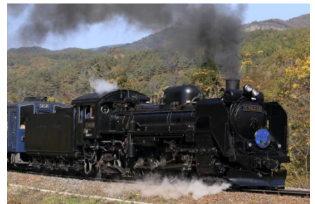
「SL 銀河」で運行されている C58-239