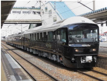
●485系「ジパング」(盛岡車両センター所属)