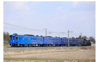
●キハ141系(盛岡車両センター所属)