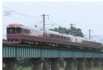
●485系「宴」(高崎車両センター所属)