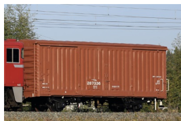
●ワム80000(盛岡車両センター所属)