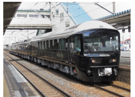
「ジパング」で運行されている 485 系