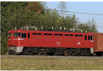
●ED75(仙台車両センター所属)