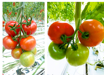
【「とまプチけーき」に使用しているトマト