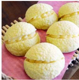
究極のメロンパン*1(鹿島製菓) (イメージ)