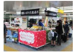
いばらき産直市(イメージ)