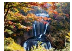
袋田の滝(イメージ)

水郡線沿線には「袋田の滝」や「奥久慈溪谷」など県内有数の紅葉スポットがあり、鮮やかに色づいた紅葉を車窓からご覧いただけます。奥久慈の紅葉が見頃を迎える11月に、普段は水郡線を走らないジョイフルトレインを使用した臨時列車を運転します。