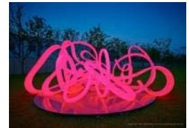
ジョン・ヘリョン JUNG Hye Ryun 袋田の滝