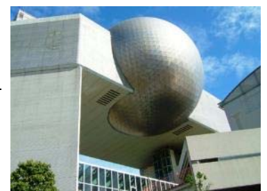
日立シビックセンター天球劇場

※日立シビックセンターでは、芸術祭会期中にプラネタリウムのほか屋内外でアート作品が展示されます。