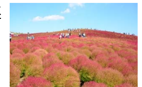
国営ひたち海浜公園(イメージ)

国営ひたち海浜公園では、秋になるとコキアが鮮やかに紅葉し、真っ赤な絶景が広がります。コキアが見頃を迎える10月に、国営ひたち海浜公園へのお出かけに便利な上野東京ライン直通の臨時列車を運転します。