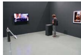
ソンミン・アン Song-Ming ANG 常陸大子駅前商店街(大子町地域おこし協力隊事務所)