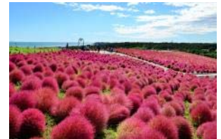
国営ひたち海浜公園(イメージ)