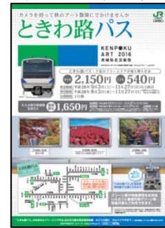
「とぎわ路バス」パンフレット