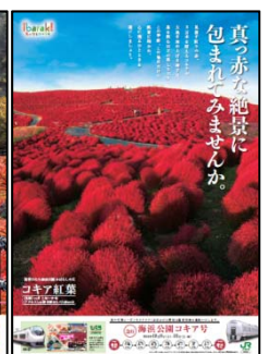
B1ポスター「ココア」（イメージ）