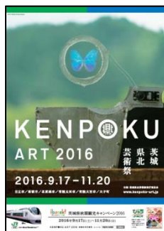
B1ポスター「芸術」（イメージ）