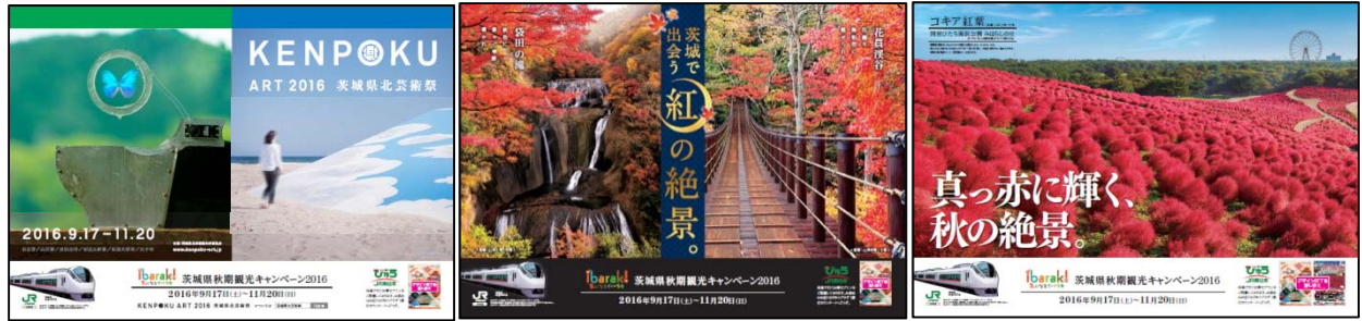
B3ポスター「芸術」(イメージ)