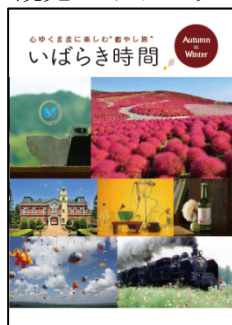
観光ガイドブック（イメージ）