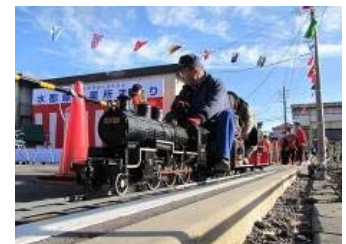
ミニSL体験乗車(イメージ)