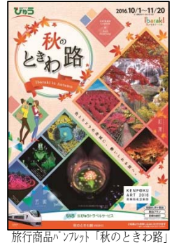
旅行商品パンフレット「秋のときわ路」

【ポイント】芸術祭会期中に運行される展示会場周遊バスを利用し、アート作品を1日で効率よく鑑賞できるツアーバスプランです。（「秋のときわ路」パンフレットP1・2参照）