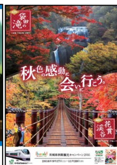
B1ポスター「紅葉」（イメージ）