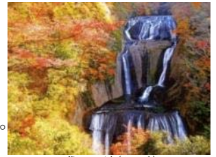
袋田の滝(イメージ)

【ポイント】春はネモフィラによる青一色の絶景が広がる国営ひたち海浜公園。秋の紅葉シーズンには美しく色づいたコキアによる赤一色の絶景をお楽しみいただけます。(「秋のときわ路」パンフレットP8参照)