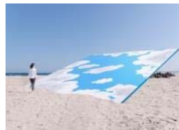
イリヤ&エミリア・カバコフ Ilya&Emilia KABAKOV 高戸海岸