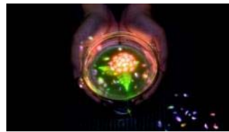
チームラボ teamLab 茨城県天心記念五浦美術館