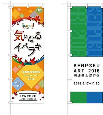
「気になるイバラキ」のぼり旗(イメージ)