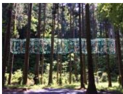
森山茜 Akane MORIYAMA 御岩神社