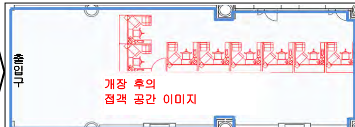
【확장 점포의 이미지】