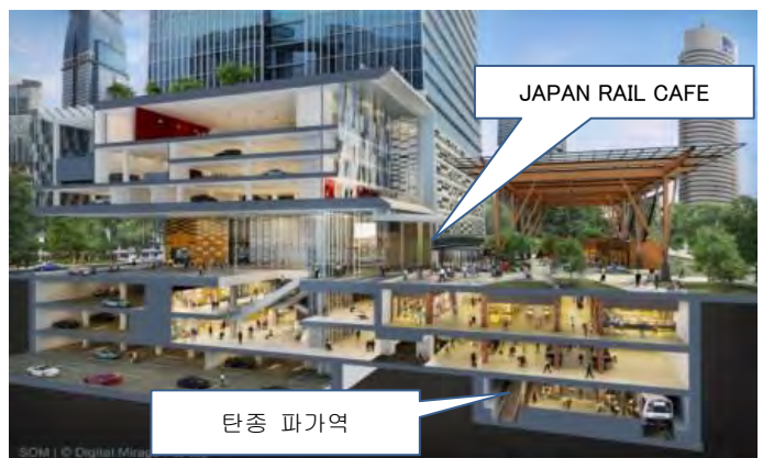
JAPAN RAIL CAFE 에 오시는 법