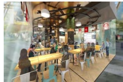
매장 내 이벤트 이미지

일본을 느낄 수 있는 계절감이 있는 요리와 음료 제공, 잡화·식품 등을 판매합니다.