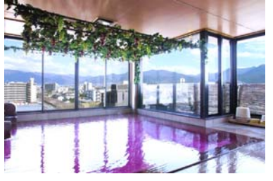
いちごランド(イメージ)