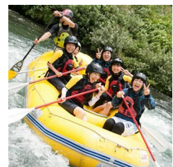
リバーアクティビティ（イメージ）