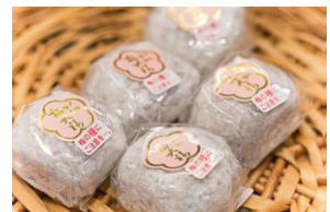
梅菓匠にしむら 梅大福 ※その他多数商品もご用意します