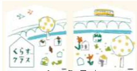
シャッターアート ※イメージ