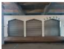
現在の「くらすルーム」シャッターの様子