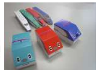
とれたんずペーパークラフト ※イメージ