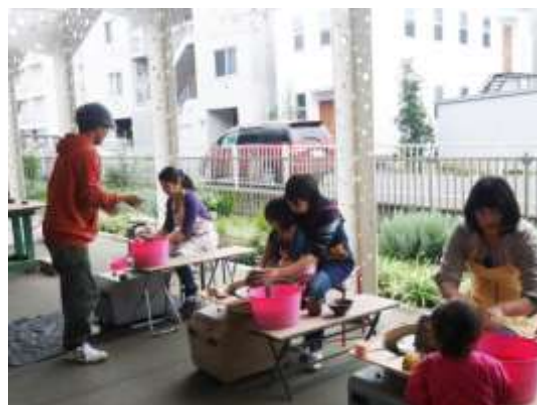
▲おとなも子どもも楽しめるクラス（講座）を開催。写真はろくろを回すクラス