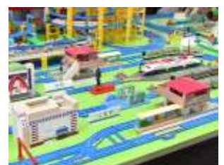
プラレールジオラマ ※イメージ