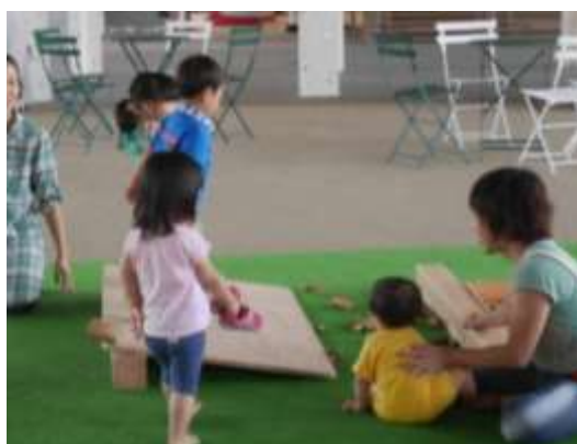
▲「くらす広場」は日常的に、遊具で遊ぶ子どもたちでにぎわう