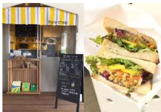
▲テイクアウト型のサンドイッチ店（kura-stand）を併設