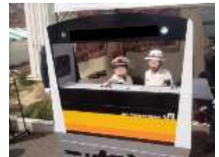
記念撮影 ※イメージ