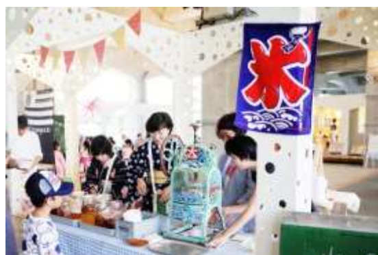
▲季節毎にテーマを設け、くらす市（マルシェ）を開催