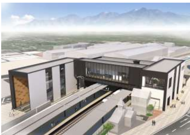
全体完成イメージパース