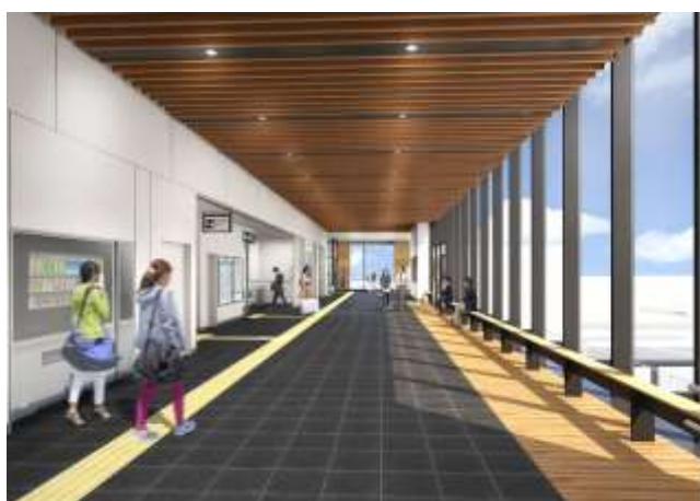
自由通路完成イメージパース