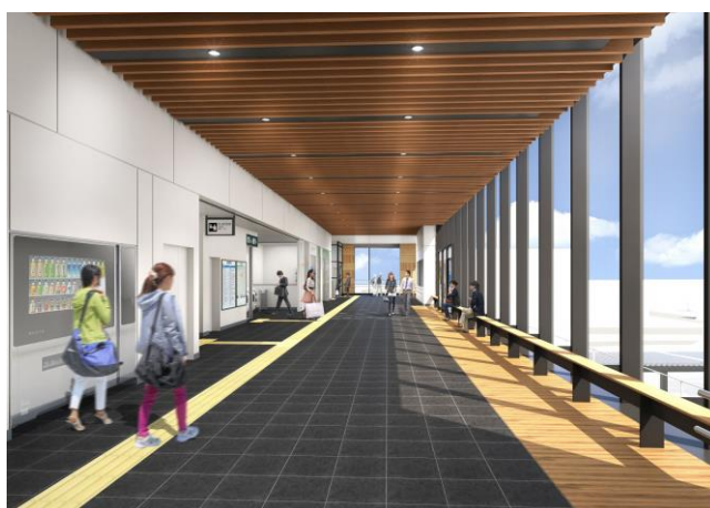
自由通路完成イメージパース