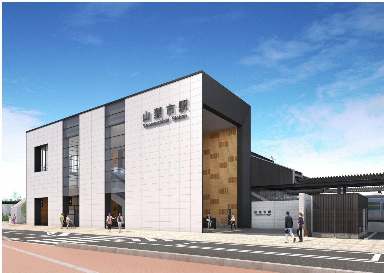
北口完成イメージパース