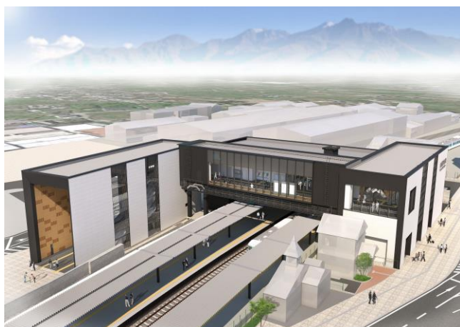
全体完成イメージパース