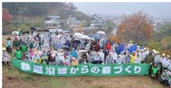
【平成 26 年に実施した森づくりの様子】