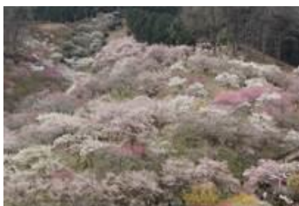
【伐採前の梅の公園】