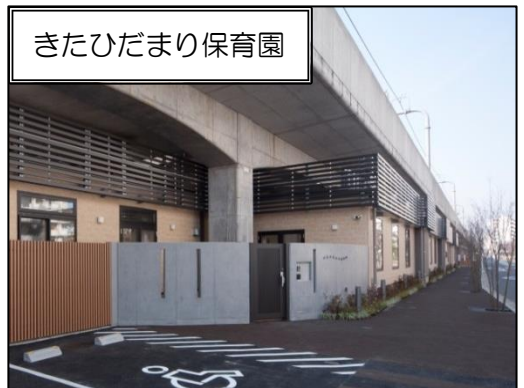
きたひだまり保育園

6 その他 街の回遊性向上を目的とし、地域にお住まいの皆さまや来街される方が快適に歩ける歩行空間「ののみち」を整備します。