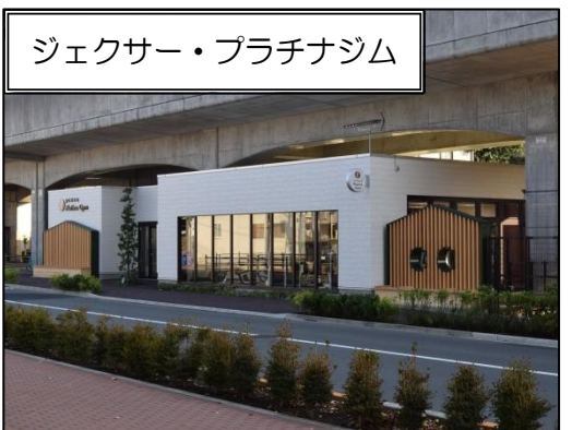
ジェクサー・プラチナジム