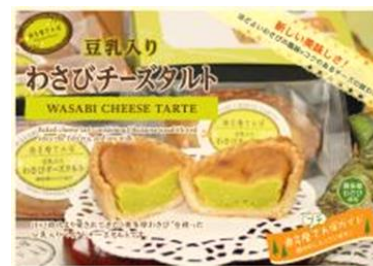
わさびチーズタルト

江戸時代より愛されてきた「奥多摩わさび」を使用した、豆乳入りバイクドチーズタルトです。香り豊かなわさびの風味と、厳選したチーズのコクのある味わいがあわさり、今までにない新しい美味しさをうみだしております。