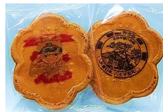
青梅駅長せんべい

卵たっぷりの上質瓦せんべいに、駅社員が描いた駅長のイラストと青梅駅のスタンプをプリントした、駅長おすすめフェア限定のせんべいです。