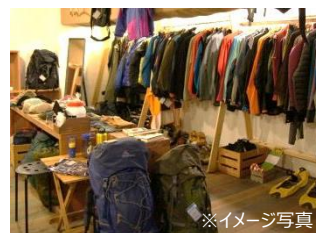
リサイクル登山用品

奥多摩エリアや駅周辺情報のご提供やリサイクル登山用品、カフェサービス、雑貨販売などで展開する複合ショップ「ポートおくとま（仮称）」が奥多摩駅の2階にオープンします。JRと西東京バスのお乗り継ぎのお時間に楽しめる空間です。また、奥多摩の美味しい水、「奥多摩天然水」もおすすめです。