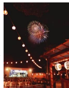
奥多摩納涼花火大会

夏の風物詩「第68回青梅市納涼花火大会（8月6日開催）」と「第39回奥多摩納涼花火大会（8月13日開催）」を鑑賞してみたいかがでしょうか。御岳山で9月11日まで開催される「第17回レンゲショウマまつり」もおすすめです。