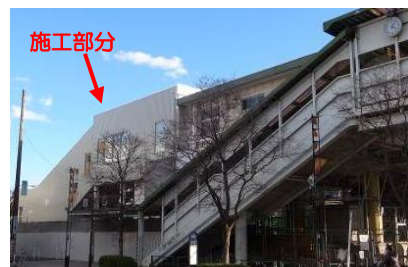
施工部分の外観（北口より）