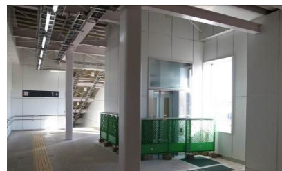
使用開始に向け準備調整中のエレベーター