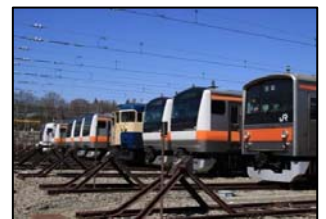
車両展示(イメージ)

イベントの詳細については、11月上旬にJR東日本八王子支社HPや、駅ポスターなどでお知らせします。