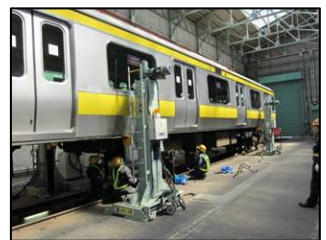
ジャッキアップ車両(イメージ)