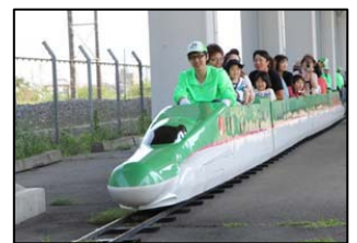
ミニ新幹線(イメージ)