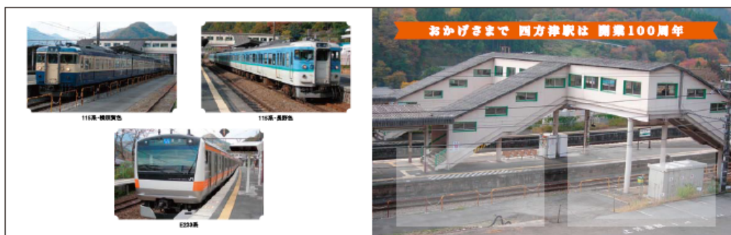
【記念入場券台紙イメージ】