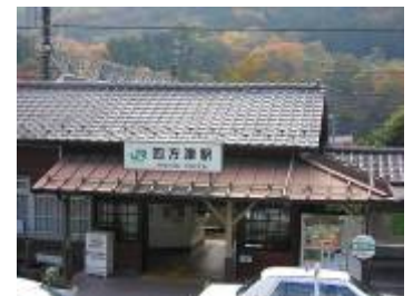
【現在の四方津駅駅舎】

【出席者】上野原市長、上野原市議会議長、上野原市教育委員会教育長、上野原警察署長、 上野原市消防本部消防長、四方津駅開設百年祭実行委員会会長 JR東日本八王子支社営業部長、上野原駅長