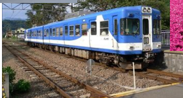
富士急行線(イメージ)