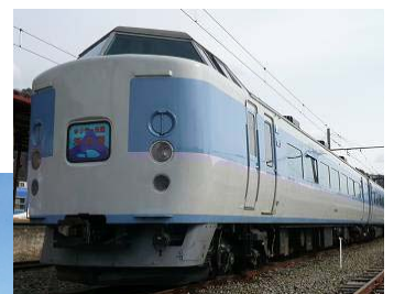
ホリデー快速河口湖号(イメージ)