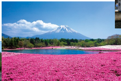
富士芝桜まつりと富士山(イメージ)