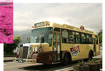
レトロバス(イメージ)