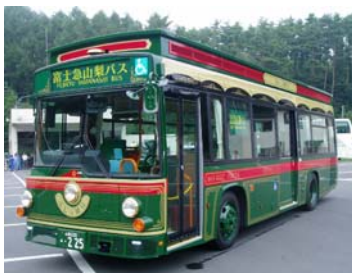
ふじっ湖号(イメージ)