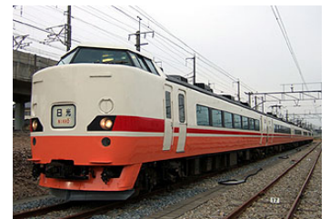
特急「はちおうじ日光」 (189系「彩野」)イメージ

(4) 主な出席者 ・日光市長 ・八王子市副市長 ・東武鉄道営業部 ・JR東日本八王子支社長