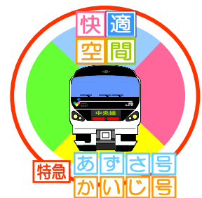
【ワンコインポスター統一ロゴ】

各駅で掲出する「ワンコイン利用促進」ポスターには統一ロゴとキャッチコピー（快適空間 特急あずさ号・かいじ号）を使用し、駅や列車内での放送によるご案内や、ホーム上の自由席特急券売機付近に特急の時刻表を掲出するなどの工夫を凝らして、ワンコイン利用の快適性や速達性をアピールしてきたところ、お客さまには大変ご好評をいただき、2008年度上半期では、この区間の上り列車だけでも延べ23万人以上（前年同期比約116%）のお客さまにご利用いただいています。