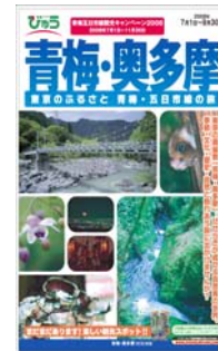
パンフレット表紙

掲載商品発売開始日：2008年6月下旬 設 定 期 間：2008年7月1日～9月30日 コ ー ス 数：5コース パンフレット配布箇所：首都圏のびゅうプラザ 発 売 箇 所：首都圏のびゅうプラザ