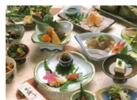
山楽荘料理の一例

行 程：1泊2日 代 金：大人1人10,600円～12,900円 内 容：バス・ケーブルカー+1泊2食 宿泊施設：原島荘、東馬場、能保利、丸山荘、嶺雲荘、宝寿閣、藤本荘、山楽荘の8件 お 勧 め：御岳山から湧き出す清水と神前に供えた旬の素材を使用した料理でおもてなし バス・ケーブル通常料金1,630円を含みます ムササビ見学会、レンゲショウマ祭り・夜神楽などのイベントを開催