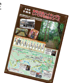
パンフレット表紙イメージ