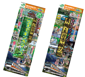
パンフレット表紙イメージ