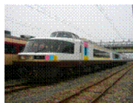
485系「NO. DO. KA」