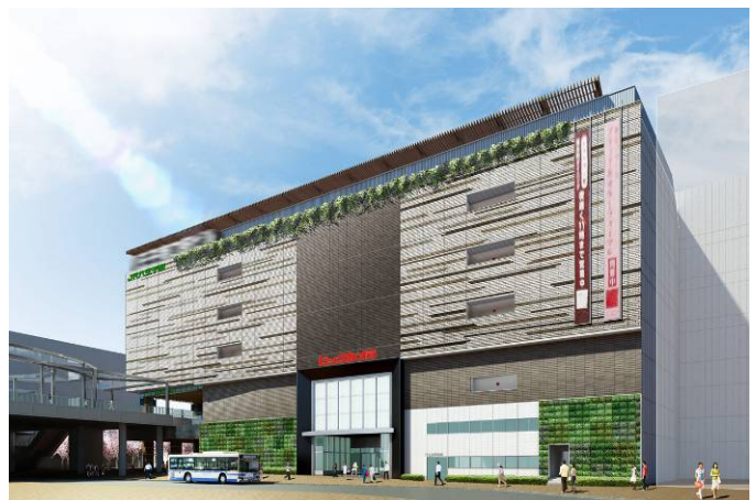
■ビル外観イメージ