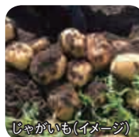
じゃがいも(イメージ)