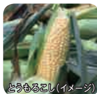
とうもろこし(イメージ)