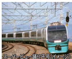
スーパービュー踊り子号(イメージ)