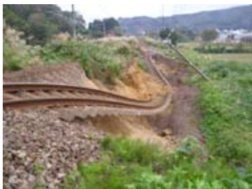
盛土の損傷例及び補強イメージ

上記耐震補強対策等について、約5年間を重点的な整備期間として推進し、災害に強い鉄道づくりに邁進してまいります。