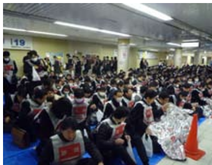
東京駅での訓練の様子

このほか、2011年9月1日に行った渋谷・千葉駅等での訓練や、2012年2月3日の東京・新宿・池袋駅での訓練など、関係自治体等と共に帰宅困難者対応訓練を実施し、地元自治体との課題共有や、地域と一体となった震災への備えに取り組んでいます。