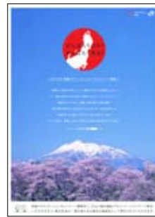
青森デスティネーション キャンペーンポスター

さらに東日本大震災発生後から被災エリアではエスパル仙台、エクセル水戸などで店頭において食料品を中心に販売を行いました。また、首都圏では、上野駅等において被害を受けた地域を応援する目的で、「応援産直市」「応援物産展」「応援工芸市」を開催し、各県の魅力を情報発信するとともに、野菜や加工品、伝統工芸品等の販売を実施しました。