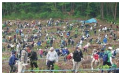
安達太良ふるさとの森づくり

2004年から福島県安達太良地域の国有林で、JR東日本グループ全体の取り組みとして「安達太良ふるさとの森づくり」を行っています。これは、自然に近いかたちで密植・混植し、自然淘汰を経ながら「ふるさとの森」を作り上げる取り組みです。2009年5月に実施した「安達太良ふるさとの森づくり」には約1,800名の方にご参加いただき、1.7万本の苗木を植樹しました。