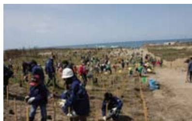
(財)イオン環境財団と共催した 「秋田下浜海岸植樹」

JR東日本が所有する秋田市下浜海岸の鉄道林(羽越本線沿線)において、マツ食い虫の被害を受けた松林の再生を目的に、JR東日本秋田支社と(財)イオン環境財団の共催で植樹活動を行いました。約880名の方にご参加いただき、約1万本の苗を植樹しました。