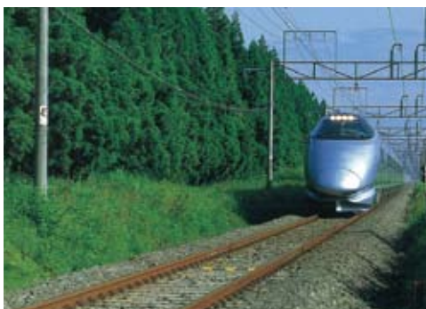
奥羽線 関根1号林(ふぶき防止林)

2008年からは、線路の防災と沿線の環境保全の両立を目指して鉄道林のあり方を根本的に見直し、更新時期を迎えた樹木を約20年かけて植え替える「新しい鉄道林」プロジェクトをスタートしました。