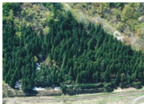
米坂線 手ノ子6号林(なだれ防止林)