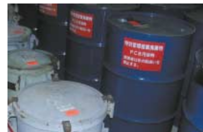
専用保管庫などにて厳重な管理を行っています

これまでPCBを絶縁油として車両や変電所などで使用してきましたが、PCBを含まないものへ取り替えを進めています。また取り替えたPCB機器は82箇所の保管庫などで厳重に保管し、法令に基づいて届出を行っています。 無害化処理については、PCB廃棄物処理施設の稼働状況、国の検討状況を踏まえて検討を進めています。