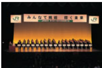
本社での小集団活動発表大会の様子

提案活動は、社員が業務についての有益な意見を提出する活動で、2005年度は約68万件、1人あたり12.7件の提案がありました。