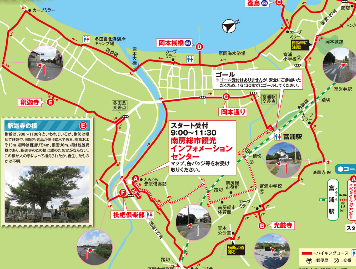
枇杷倶楽部と菜の花